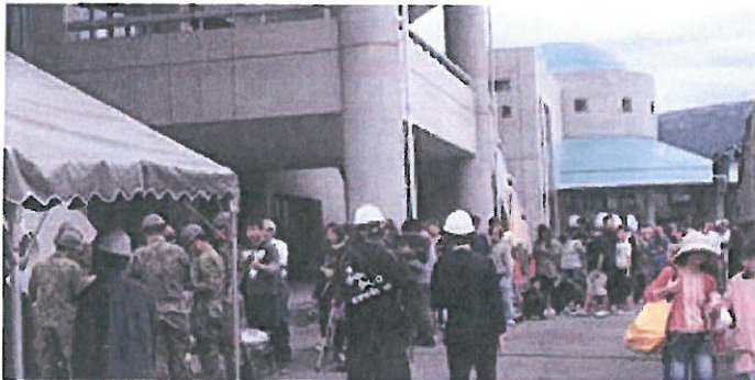
右後方、緑の屋根が、避難所となっている「益城総合運動公園・体育館」