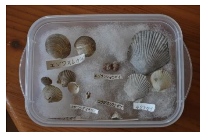
黒松内ブナの森化石キャンプ

※各キャンプにテーマを設定しており、そのテーマに沿って、具体的なプログラムが組み立てられます。キャンプによりスケジュールは異なります。詳しくは、各キャンプのスケジュール予定を参照ください。