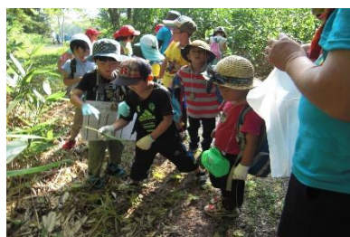
道民の森キャンプ