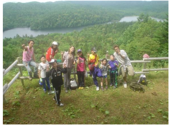
チミケップキャンプ