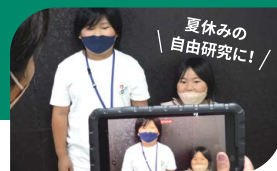
最少催行人数4名 ※送迎バスはありません。